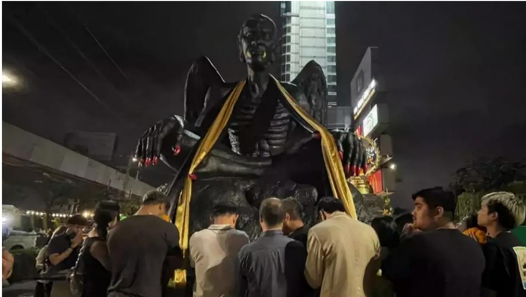
ภาพครุฑกายแก้ว ผู้เรืองเวทที่ได้รับการยกย่องตั้งเทพผู้บันดาลโชคลาภจนเกิดเป็นกระแสสังคม ในประเทศไทย ปี พ.ศ. 2566

ที่มา : https://plus.thairath.co.th/topic/politics&society/103603 วันที่