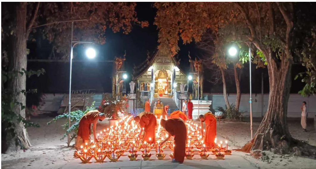
ภาพการเตรียมพิธีกรรมจุดเทียนลดเคราะห์ เพิ่มลาภและอุทิศบุญกุศล ในวัดชนบทแห่งหนึ่งของจังหวัดเชียงใหม่ โดยมีกลุ่มผู้ร่วมพิธีเป็นชาวจีนในประเทศต่างๆ ที่แจ้งความประสงค์มาทางผู้ประสานงาน การประกอบพิธีกรรมจะถูกถ่ายทอดสดถึงผู้ร่วมพิธีผ่านทางอินเทอร์เน็ต

สรุปได้ว่า ความเชื่อเรื่องไสยศาสตร์เป็นสิ่งที่สนองความต้องการมนุษย์ในยุคปัจจุบันได้มากกว่า ในขณะที่ศาสนามุ่งเน้นไปที่การทำมาดีและทำจิตใจตนเองให้สงบ (ลัญจกร นิลกาญจน์ 2561)