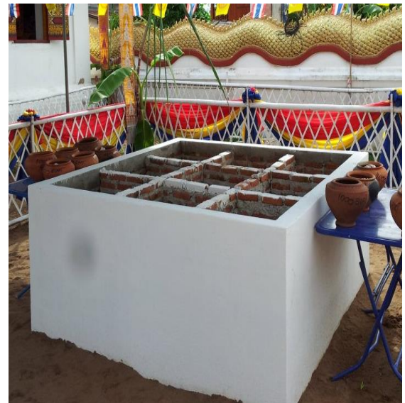
ภาพที่ 2. แผนผังแสดงสัตตมหาสถาน สะตวงแก้วห้องจากพิภพสาวัดนาเลาลำปาง

และภาพขุมธาตุสะตวงแก้วห้องในการก่อฐานรากพระเจดีย์วัดนาบุญ จ.แพร่ 2557