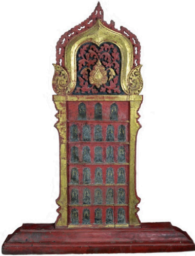
พระแผงไม้ซุ้มทรงบรรพตแดงแบบซุ้มหน้านาง: พระแผงไม้ในพิพิธภัณฑ์สถานแห่งชาติ เชียงใหม่ รทส 15/2516 มีจารึกระบุปีสร้าง พ.ศ. 2370