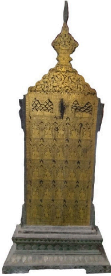
ชุ่มทรงกรอบชุ่ม: พระแสงไม้ในพิพิธภัณฑ์วัด เชียงใหม่ มีจารึกว่าสร้าง พ.ศ. 2409 เชกเมง (เจ๊กเส็ง?) เป็นช่างเขียนลายรดน้ำ