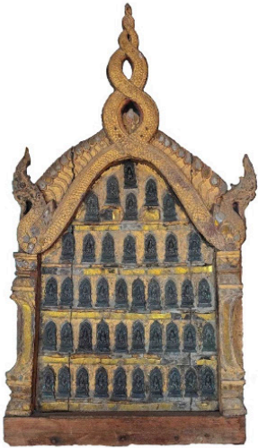
พระแผงไม้ซุ้มทรงเบ็ดเตล็ด กรอบซุ้มเป็นนาคเกี่ยว: พบในพระแผงไม้วัดดอนเปา 1 แผง ไม่มีจารึกระบุปี พ.ศ. ที่สร้าง