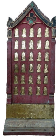
ชุ่มทรงวิมาน: พระแสงไม้ในการครอบครอง เอกชน ภายในประดับพระพิมพ์จำนวน 30 องค์ ไม่มีจารึกระบุปี พ.ศ. ที่สร้าง