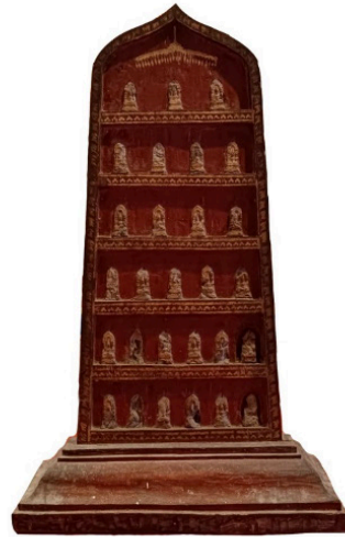
พระแผงไม้ซุ้มทรงเบ็ดเตล็ด กรอบกลีบบัว: พระแผงไม้วัดดับภัย มีจารึกด้านหลัง ไม่ระบุปีสร้าง