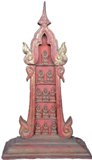
ชุ่มทรงเรือนแก้ว: พระแสงไม้ในการ ครอบครองเอกชน ภายในประดับพระพิมพ์ จำนวน 12 องค์ ไม่มีจารึกระบุปี พ.ศ. ที่สร้าง