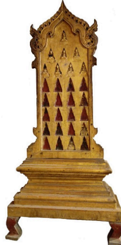
พระแผงไม้ซุ้มทรงบรรพตแดงแบบซุ้มโค้งแหลม: พระแผงไม้ในวิหารลายคำ วัดพระสิงห์วรมหาวิหาร จารึกระบุปีสร้าง พ.ศ. 2429