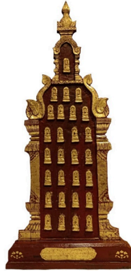
ชุ่มทรงปราสาท: พระแสงไม้ในพิพิธภัณฑ์ พื้นถิ่นล้านนา สร้างใน พ.ศ. 2498