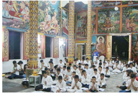
(ข) กิจกรรมไหว้พระสวดมนต์ของกลุ่ม เยาวชน