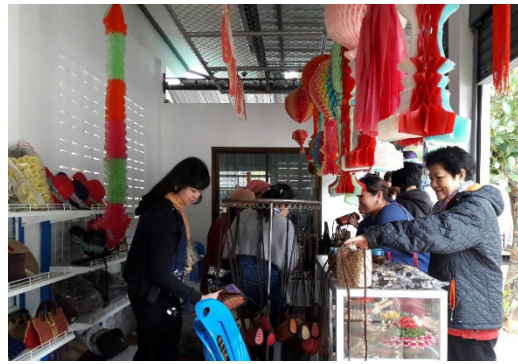
(ข) สถานที่จำหน่ายสินค้าของผู้สูงอายุ ตำบล หนองตอง