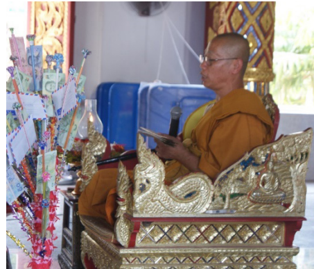
(ข) พระสงฆ์ให้โอวาทธรรม