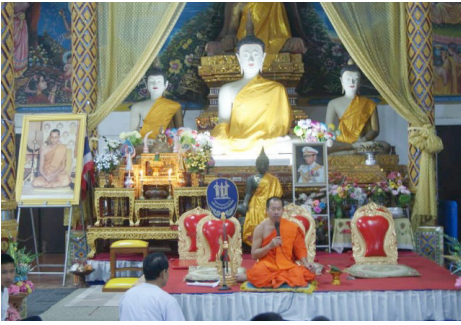
(ก) พระสงฆ์ให้โอวาทธรรม เรื่อง คุณธรรม จริยธรรมแก่เยาวชน