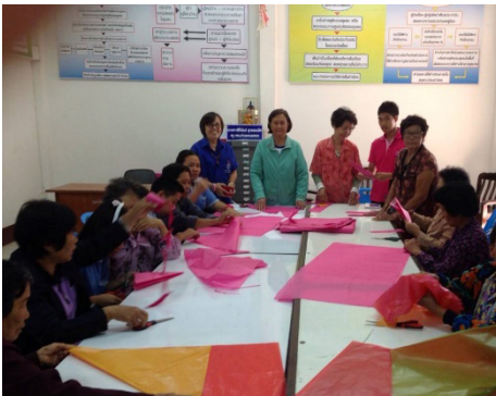
(ก) ผู้สูงอายุร่วมกันทำตุ๊ก และโคม การสร้าง อาชีพ การสร้างรายได้ จากการทำตุ๊กปีใหม่ เมือง

การส่งเสริมสุขภาพทางด้านสังคม ได้จัดกิจกรรม โครงการส่งเสริมสร้างอาชีพ สร้างรายได้ให้แก่ผู้สูงอายุ ตำบลหนองตอง โดยการทำตุ๊กตเพื่อจำหน่ายตามร้านค้า (ภาพที่ 3) ซึ่งทำให้ผู้สูงอายุมีอาชีพ มีรายได้เพิ่มขึ้น จากการเข้าร่วมกิจกรรม ทำให้การพึ่งพาจากลูกหลาน และผู้อื่นน้อยลง พึ่งพาตัวเองมากขึ้น ทำให้มีเงินเก็บออมมากขึ้น เพื่อนำไปใช้บั้นปลายชีวิต