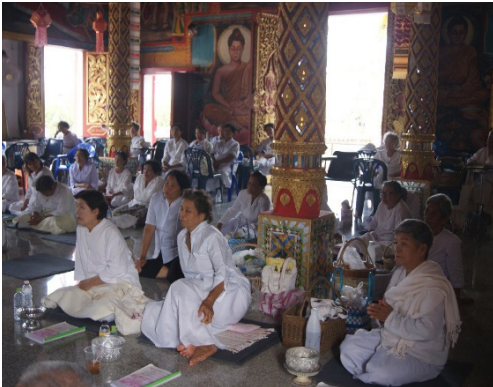
(ก) ผู้สูงอายุเข้าวัด ปฏิบัติธรรม ในวันธรรมเสวนะ

จริยธรรม และจิตสำนึกที่ดี ทำให้ผู้สูงอายุสามารถนำความรู้ที่ได้มาปรับเปลี่ยนทัศนคติการดำเนินชีวิตเป็นไปอย่างถูกต้อง ตามหลักคุณธรรม จริยธรรมของพระพุทธศาสนาทำให้มีความพร้อมและรู้เท่าทันการเปลี่ยนแปลงของสังคม